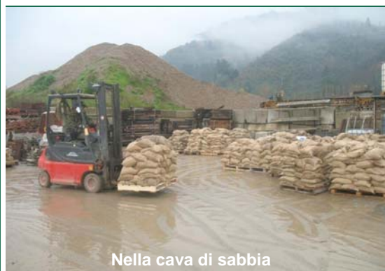
Nella cava di sabbia

preghiamo Dio che ci dia una mano e ci mettiamo di buona lena come sempre. Nel tardo pomeriggio sul piazzale di una cava si contano centinaia di pallet carichi di sabbia, le colonne di camion fanno spola per portare il tutto ai bordi degli argini dove vengono posizionati, siamo fortunati che il tempo ha tenuto. Nel frattempo apprendiamo la notizia che la situazione è sotto controllo. E' ormai sera, è vero siamo stanchi, ci guardiamo in viso e alziamo gli occhi al cielo. Grazie ai Volontari che come sempre si sono prodigati, anche questa volta abbiamo potuto portare il nostro aiuto.