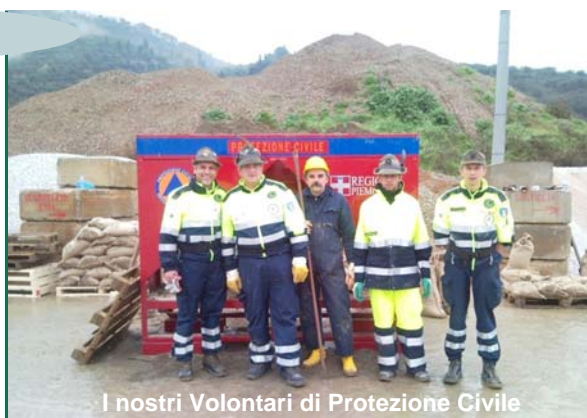
I nostri Volontari di Protezione Civile

Mentre ci stiamo godendo queste feste natalizie, su video e quotidiani nazionali del 28 dicembre non si fa altro che parlare dello stato di calamità che colpisce la Regione Toscana e precisamente la Versilia. Bollettini meteorologici preannunciano per le successive 36-48 ore forti piogge. La situazione non è del tutto allegra, il fiume Serchio ha rotto per 250 metri l'argine, facendo esondare il lago Massaciuccoli già ingrossato dalle piogge, provocando seri problemi ai paesi confinanti. Alle ore 23,45 dal Coordinamento di Protezione Civile Provinciale, arriva una